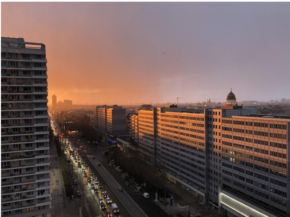
Blick auf die Leipziger Straße Richtung Westen, 2020

KISR - Kunst im Stadtraum an der Leipziger Straße